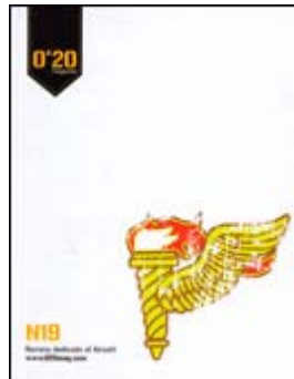
Área AirsoftPro en Ficaar 2011