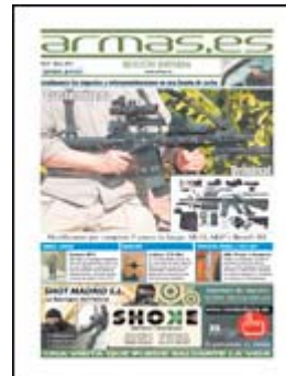
Área AirsoftPro en Ficaar 2011