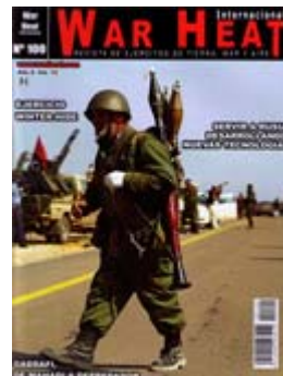
Área AirsoftPro en Ficaar 2011