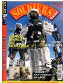
Área AirsoftPro en Ficaar 2011

MEDIA PRESS IN DE LAST EDITION OF AIRSOFT PRO Area within FICAAR 2011